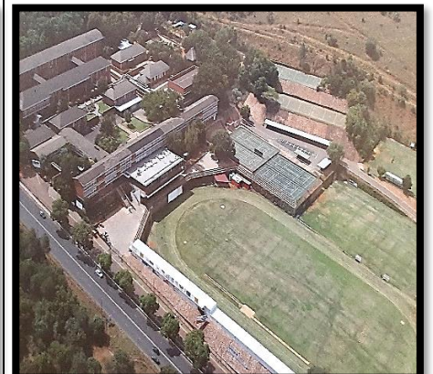
Kleurfoto van die skool soos dit tans lyk.